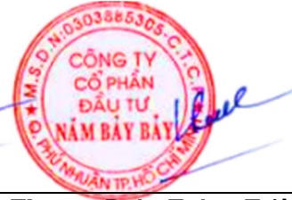
Đoàn Tường Triệu